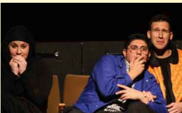
FESTIWALLA „Ick gloob, ick bin im falschen Film“