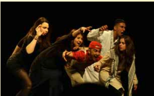
FESTIWALLA „Hass und Liebe“