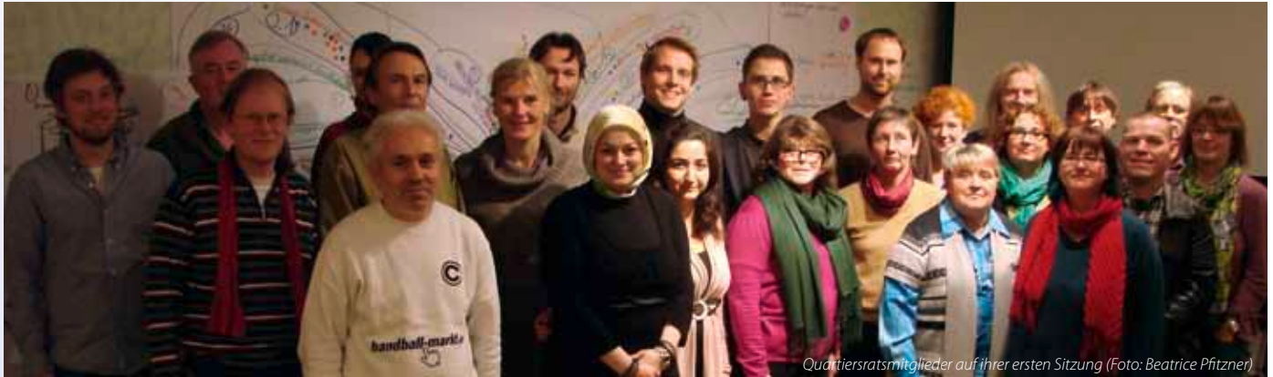
Quartiersratsmitglieder auf ihrer ersten Sitzung