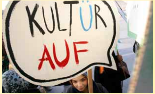
FESTIWALLA Demo