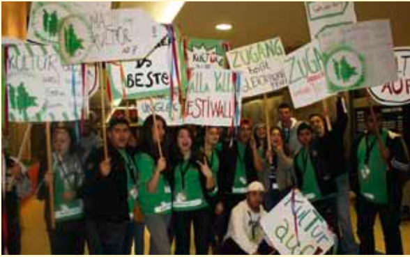
FESTIWALLA Demo