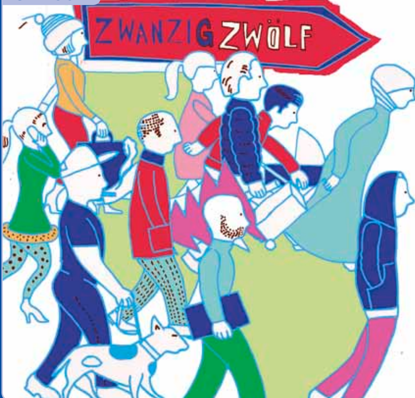
Illustration von Andree Volkmann

Was bewegt Sie in Moabit, was freut und stört Sie, und was möchten Sie im Kiez verändern?