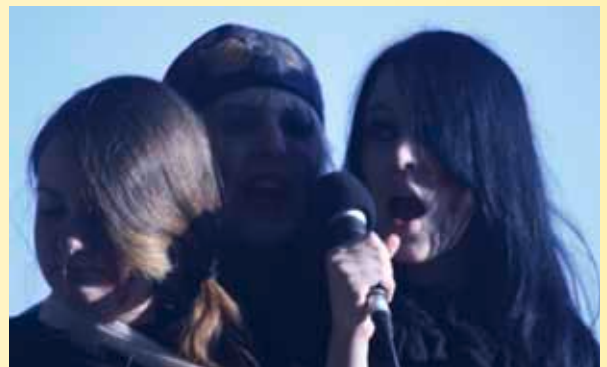
FESTIWALLA „Bamboule uffn Platz“