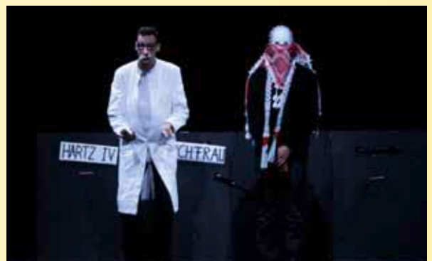
FESTIWALLA „Ick gloob, ick bin im falschen Film“