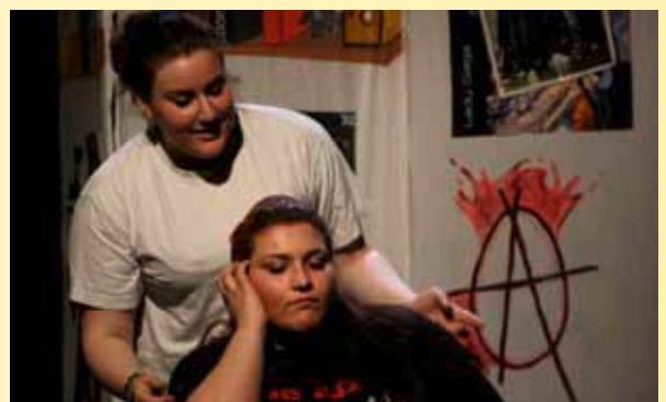
FESTIWALLA „Ick gloob, ick bin im falschen Film“