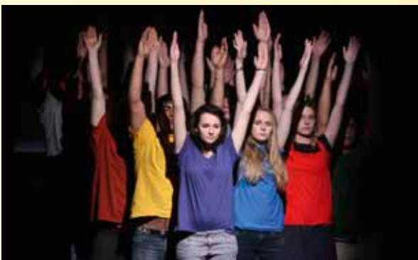
FESTIWALLA „Gaza Monologe“