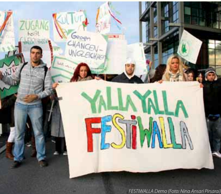
FESTIWALLA Demo