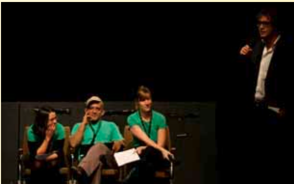
FESTIWALLA Eröffnung