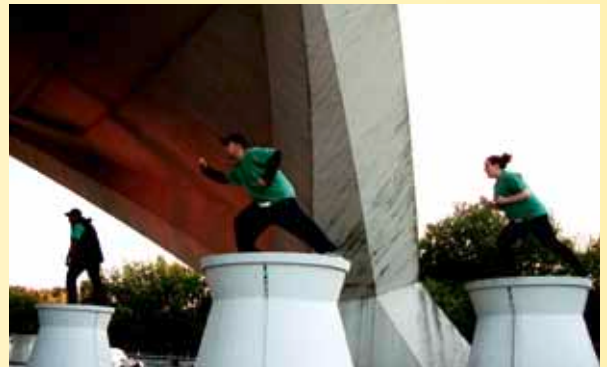
FESTIWALLA „Workshop Reclaim the building“